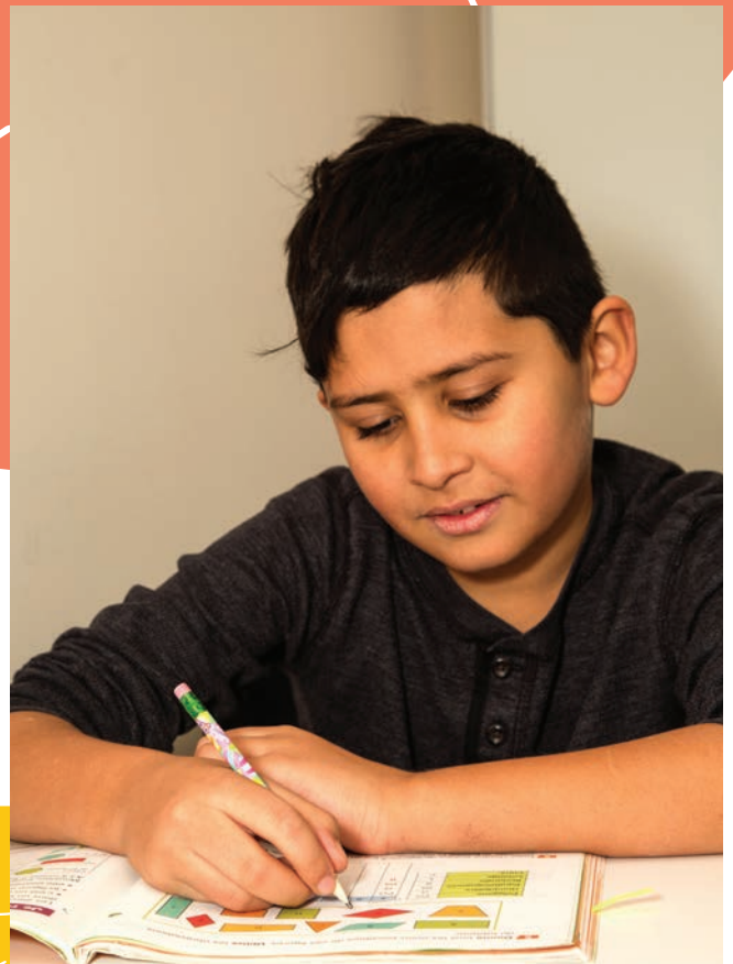
Aide aux devoirs