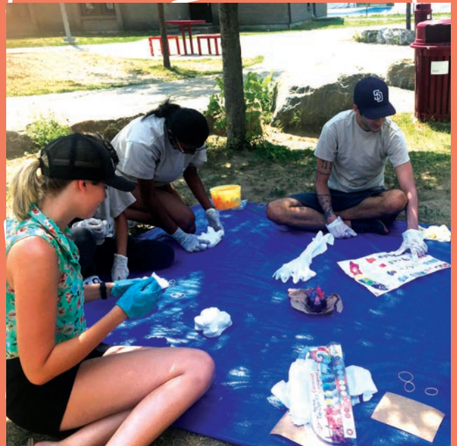
Activité durant l'été