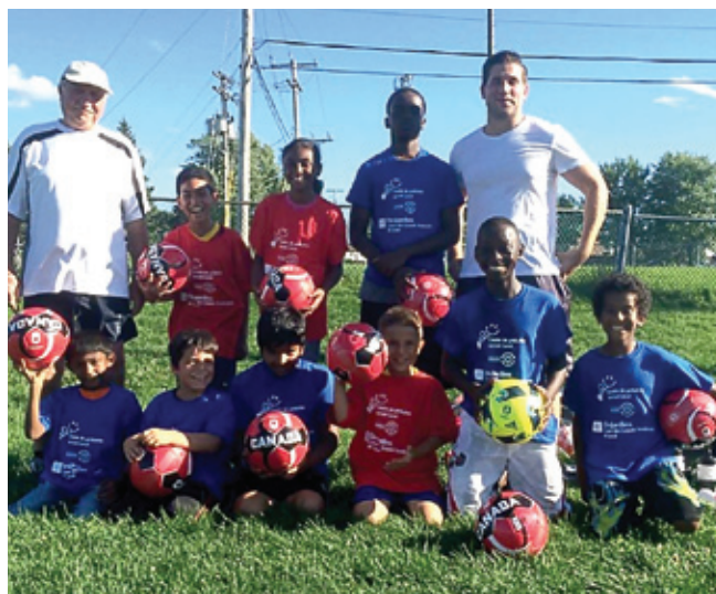
Soccer : grâce au soutien de la Caisse Desjardins des Grands-Boulevards de Laval (page 5)

Différentes activités psychoéducatives ont eu lieu cette année. En collaboration avec une chef cuisinière diplômée de l'École hôtelière de Laval, les enfants du CPSL ont bénéficié d'activités de cuisine. Chaque semaine, ils ont cuisiné de nouvelles recettes pour les transformer en délicieux petits plats. Au cours de ces ateliers de cuisine, plusieurs thématiques ont été abordées : estime de soi, gestion des émotions, anxiété, socialisation, etc.