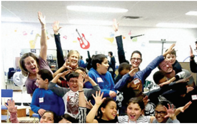
Course des pompiers de Laval