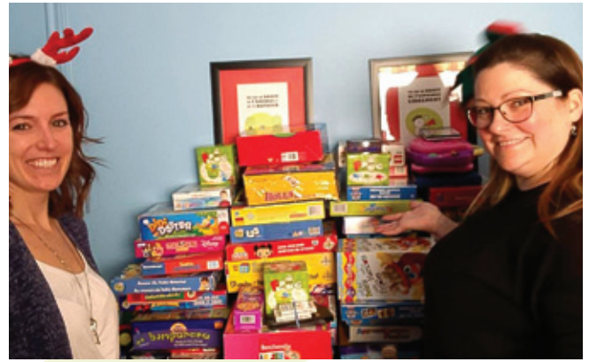
Activités spéciales de Noël