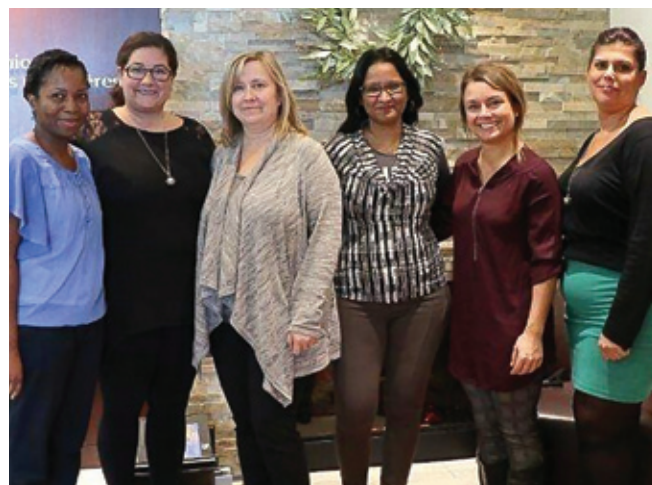
RBC Dominion Valeurs Mobilières